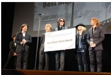
2009年 ミュージック Short PV 部門 優秀賞受賞作品: GLAY「SAY YOUR DREAM」

タイ・バンコク版『New York, I Love You』とも言えるオムニバス『サワディー・バンコク』より、ウィシット・サーサナティヤン監督（『怪盗ブラック・タイガー』）作品、ベンエーグ・ラッタナルアーン監督（『地球で最後のふたり』）作品、ソーラボン・チャートリー（『マッハ弐』）と韓国女優のイム・スジョンが主演をつとめる、アディタ・アサラット監督作品『Phuket』を上映します。