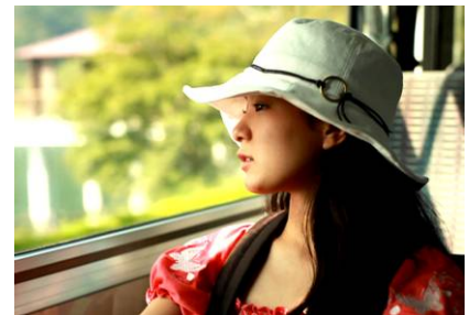
ハーネス（クローバー通りをこえて）/静岡県