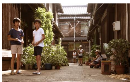
瞬くほど曖昧な夕暮れに/福岡県