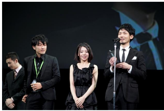
2012年度受賞の岡本雄作監督