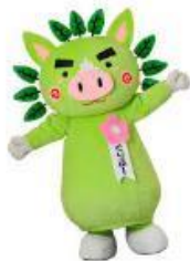
鹿児島県 ぐりぶー