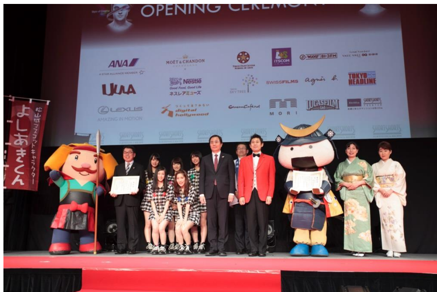
昨年のオープニングで発表された「第三回観光映像大賞」発表の様子。 観光映像大賞(観光庁特別賞):宮城県『仙台・宮城 結び旅』と、 特別賞:愛媛県松山市『マツとヤンマとモブリさん-七つの秘宝と空飛ぶお城-』 より受賞者の方々。