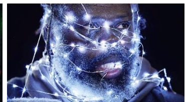
タイトル：Lights 制作企業：Adot.com