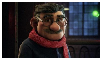
タイトル：Justino 制作企業：The Spanish Lottery

SSFF & ASIA が選ぶ国内外のブランデッドムービーを上映いたします。2015 年のホリデーシーズンに話題をさらったスペインのクリスマス宝くじのブランデッドムービー『Justino』や、社会的弱者の支援などをおこなうイギリスの慈善団体が作成したブランデッドムービー『Lights』など、多様性が十分に楽しめるラインナップをご用意しています。