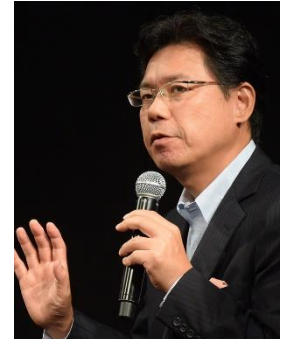
水野有平氏 グーグル株式会社執行役員 YouTube 日本代表