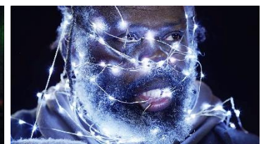
タイトル：Lights 制作企業：Adot.com