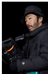
塚本晋也 (映画監督)