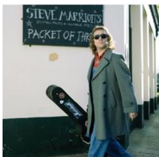
マーティン・フリーマン主演作品 『ミッドナイト・オブ・マイ・ライフ』