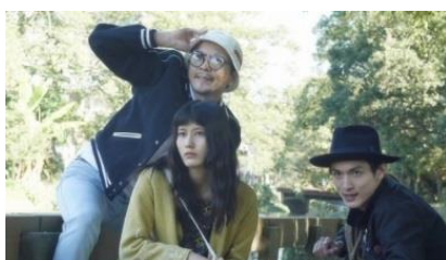
熊本県『うつくしいひと』