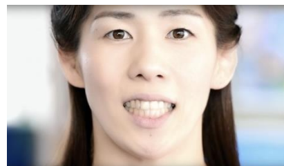
三重県津市『つ・がない世界』