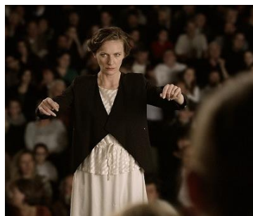
SSFF & ASIA 2016グランプリ作品 『合唱』