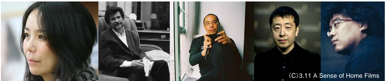
(左から)河瀬直美、ビクトル・エリセ、アピチャップン・ウィーラセタクン、ジャ・ジャンクー、ポン・ジュノ 順不同、抜粋

このビデオは、季節風が吹く夜の為の、また、遠く離れた最愛の人への、 そして窓の外の誰もいない野原への子守唄である。 —アピチャップン・ウィーラセタクン—