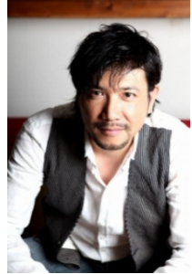
SSFF & ASIA 代表: 別所哲也

2004年6月には米国アカデミー賞公認映画祭に認定されるという栄誉を受けました。これにより、私共の映画祭でグランプリを獲得した映像作家の作品が、次年度のアカデミー賞短編部門のノミネート選考に入ることになり、日本からオスカー像を手にする若手が出現する可能性への、架け橋ができたのです。