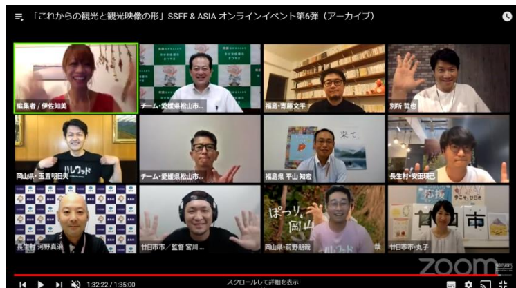
写真は2020年8月20日に行われた「これからの観光と観光映像の形」の様子