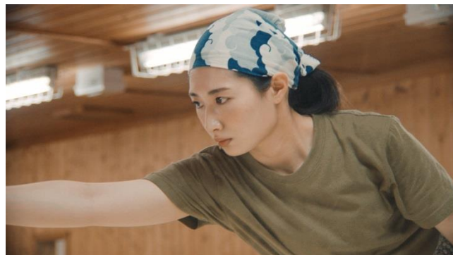
『ふるさとのにおい』(佐賀県上峰町)