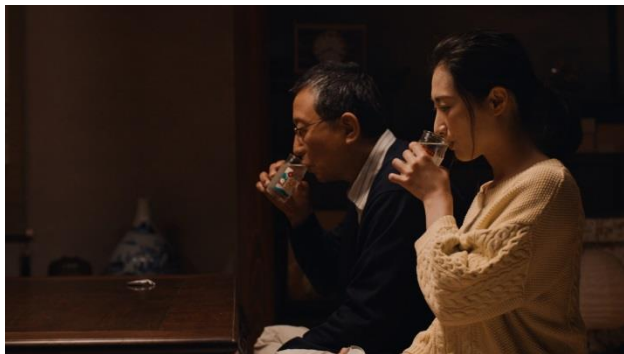
【作品名】ふるさとのにおい 【地域】佐賀県上峰町 【監督名】菊地健雄 / 8分 / 2020

「故郷に戻った。帰省ではない、帰郷だ」東京から故郷の上峰町に戻ったいつの間にか幼馴染は一人前になっていて――