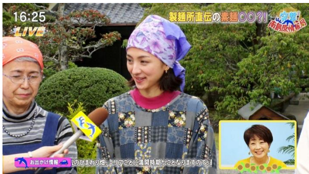
【作品名】突撃！南島原情報局【神回】 【地域】長崎県南島原市 【監督名】渋江修平 / 27分 / 2021

ムービーの舞台は、南島原市の旬をお伝える週末情報番組「突撃！南島原情報局」。想定外の出来事が次々に起こり、のちに神回となる放送回がついにyoutubeにアップされた！！架空の情報番組に、架空のCM。そして満島ひかりさんが演じる癖が強すぎる南島原市民たち。南島原の多彩なコンテンツを、エンターテインメントな演出でインパクトをもたせて伝える約27分間です。