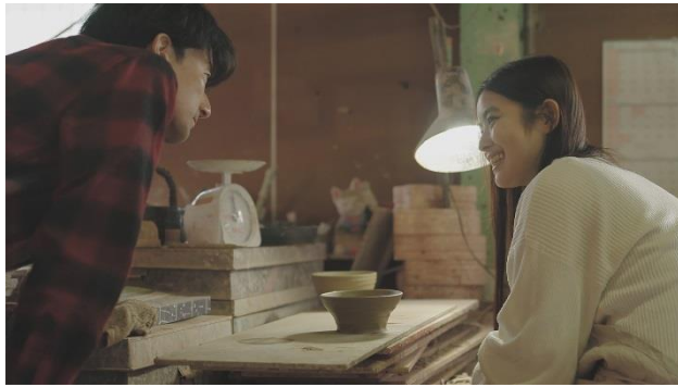
【作品名】泣きたいのに泣けない私 【地域】愛知県常滑市 【監督名】柴山健次 / 7分 / 2020

仕事に悩み落ち込んでいた一人の若い女性がある日、友達が勧めたアニメ映画「泣きたい私は猫をかぶる」を観て、主人公のムゲのように強い自分になりたいと足を運んだ場所がアニメの舞台となった『愛知県常滑市』。「泣き猫」の世界観を体感し、どこか懐かしさを感じる街に癒されるなど、自分探しの旅となる。常滑は、ムゲのように強い自分を見出せるきっかけをくれた街だった。