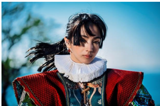
『突撃！南島原情報局【神回】』(長崎県南島原市)

第10回目となる今回は、全国65本の観光プロモーション映像の中から選考を行い、「地域をブランディングする」5本の映像作品をファイナリストとして発表いたしました。