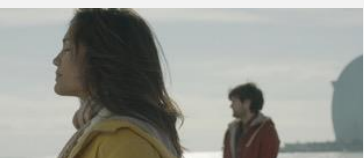
ジュリアの終わらぬ旅 / Lonely Planet (Alex Burunova監督 / アメリカ・スペイン / 約24分) 訳あり旅行誌ライターがハルセロナっ子と過ごす3ヶ月 名所名跡を背景に旅気分も味わえる作品