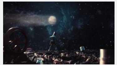
宇宙の恋 / Cosmic Fling (Jonathan Langager監督 / アメリカ / 約10分) 夢のような人形アニメーション SSFF & ASIA 2020 CGアニメーション部門優秀賞