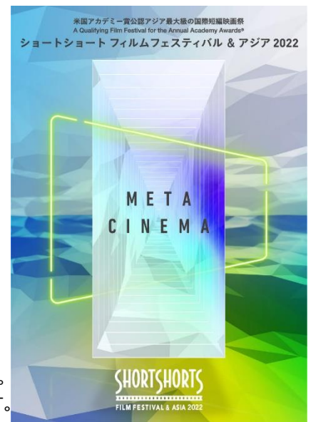
<映画祭ポスタービジュアル>