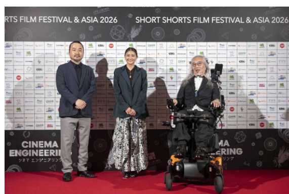
アニメーション部門の審査員