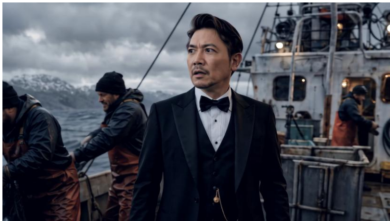
(C) 監督:山口ヒロキ (GAUMAPIX)