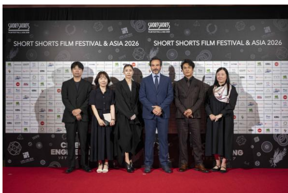
SSFF & ASIA 2026 ライブアクション部門、ノンフィクション部門の審査員